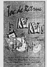
Casset de 'Kei-kei' compacte, i també en casset, que recull totes les cançons d'aquest