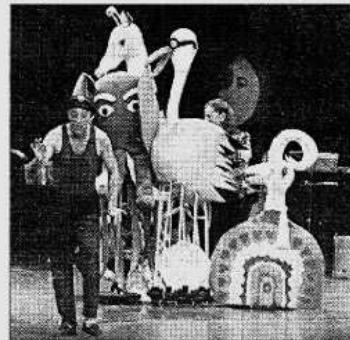
Un moment de 'Kei-kei', que es fa als Lluïsos de Gràcia

Finalment, a Kei-kei , l'espectacle que ara tornen a